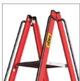
Barandas de seguridad

*Los accesorios de las escaleras se venden por separado y complementan su funcionamiento. Para consultas, contacte a su asesor comercial.