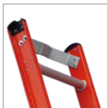
Apoya poste metálico antideslizante