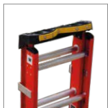
Bandeja dieléctrica V-topTool

*Los accesorios de las escaleras se venden por separado y complementan su funcionamiento. Para consultas, contacte a su asesor comercial.