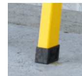
Zapatas en caucho antideslizante.