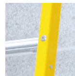
Rieles en FRP. No la afecta la corrosión.

Nuestras escaleras tipo lector son ideales para una amplia variedad de usuarios, desde los trabajadores de la construcción hasta los técnicos de servicio, electricistas y otros profesionales que buscan una solución de escalera segura y duradera para su trabajo diario.