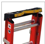
Bandeja dieléctrica V-topTool

*Los accesorios de las escaleras se venden por separado y complementan su funcionamiento. Para consultas, contacte a su asesor comercial.