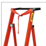
Correa de amarre

*Los accesorios de las escaleras se venden por separado y complementan su funcionamiento. Para consultas, contacte a su asesor comercial.